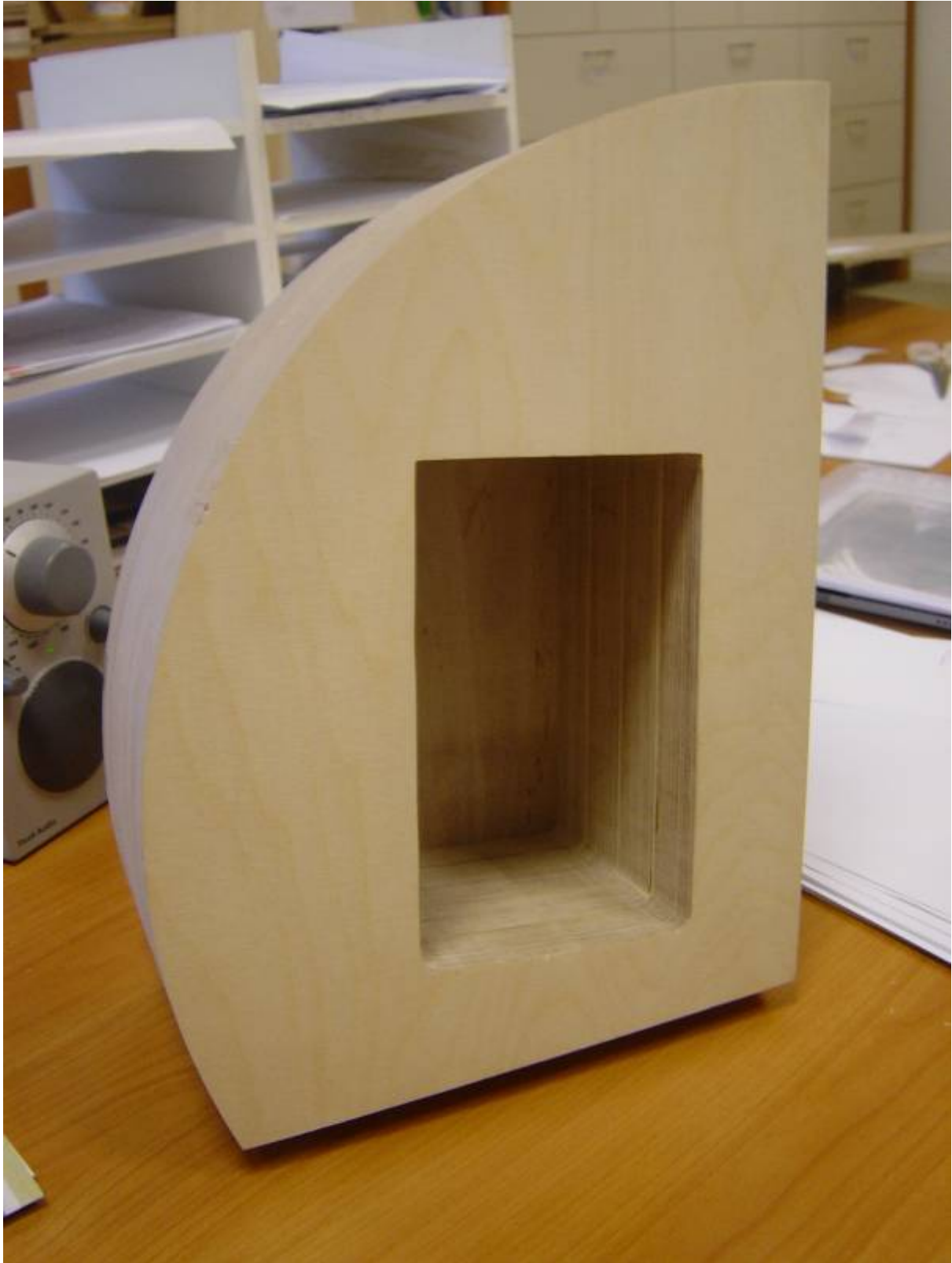
(Ontwerp, realisatie: Anton van Dellen/Arie van der Dussen)