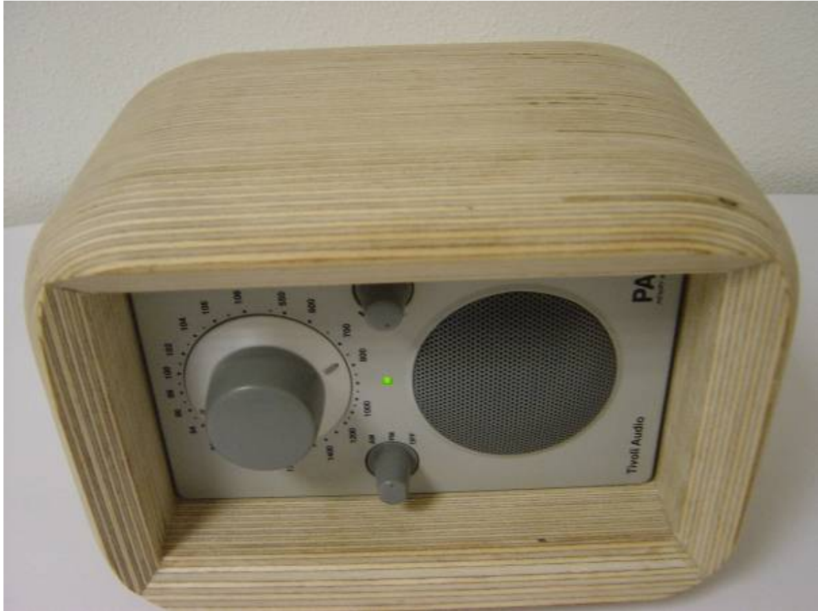
Foto: De PAL box met de PAL radio erin. Hier kunt u zien waarom het deksel zo makkelijk kan worden geopend zonder een greepje De Box kan hetzij rechtop, op een van de zijden of op zijn 'rug' worden geplaatst. Ik wilde deze BOX niet gelakt hebben, dat is de beste manier om het hout te voelen en gisteren zei een bezoeker spontaan: dat is het 'foetus gevoel'..... (Het voelt dan ook heel lekker, zacht en rond aan...)