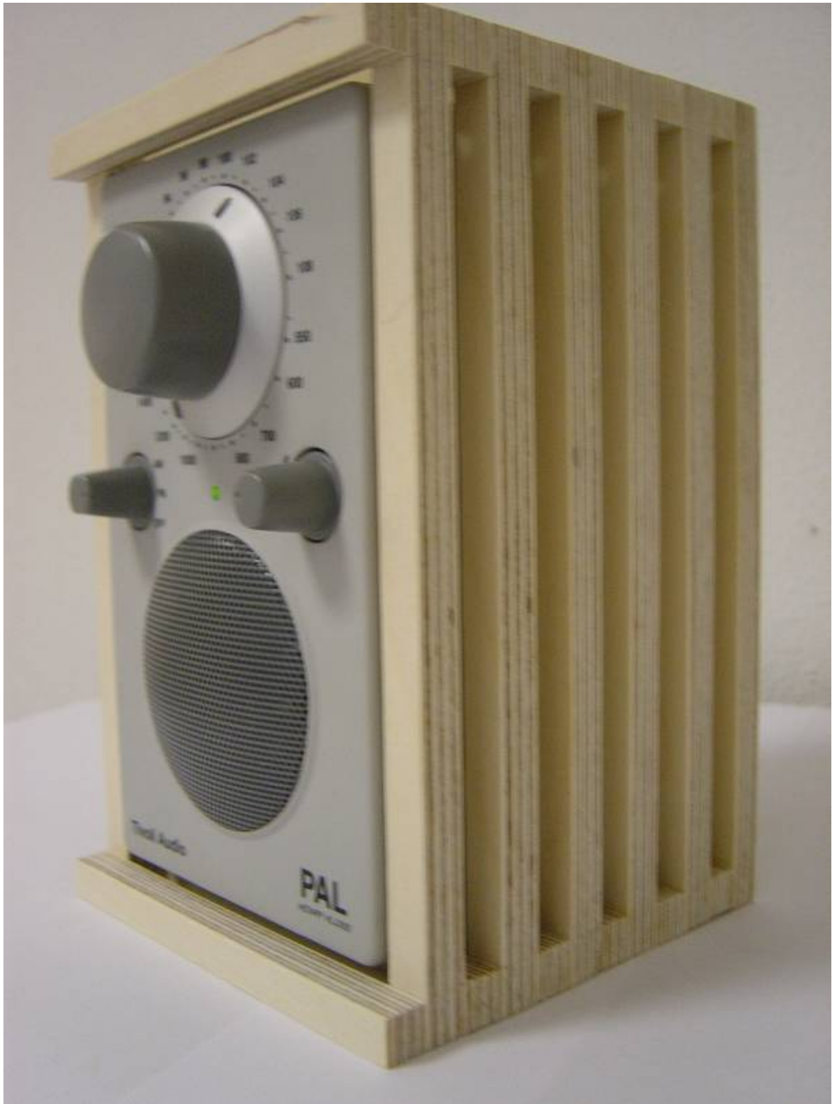
Design en realisatie: Matthijs van Achterberg.