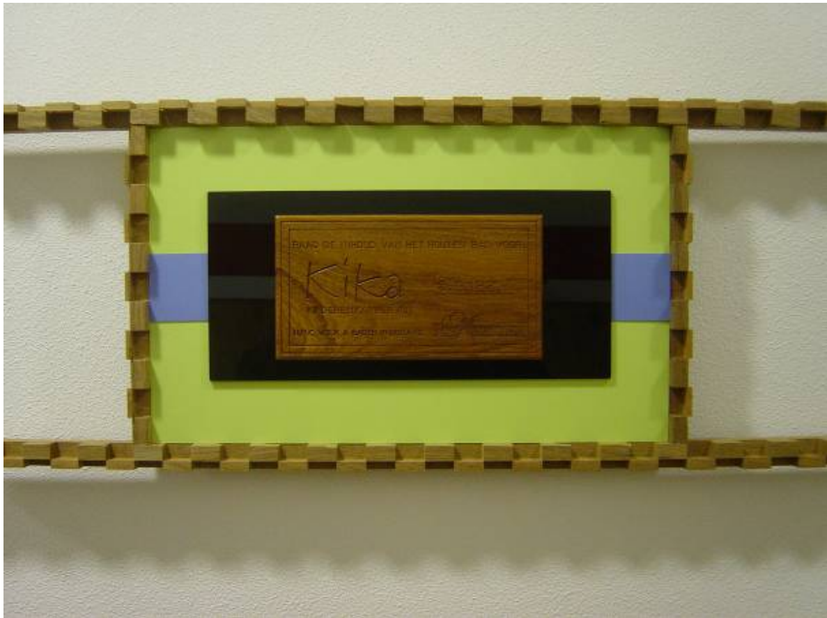
Foto : De KiKa Cheque, ingelijst in 'afval' van de werkvloer... U ziet resten van een teakhouten blokkrooster en formica-afvalstukjes De lijst is als een foto uit een filmpje, een filmbeeldje (een 'snapshot' in ons leven) Gemaakt door Anton van Dellen.