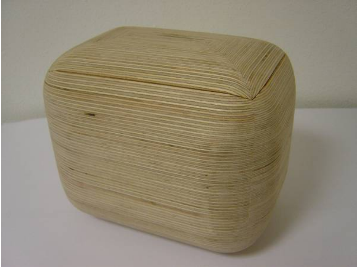
Foto :: De PAL BOX gesloten> De BOX is gemaakt in FINNFOREST berken multiplex, het deksel sluit zo perfect dat je de PAL Radio die aanstaat niet hoort als je het deksel sluit....

Ik wilde geen handgreep of gaatje in het deksel. Je kunt het deksel heel gemakkelijk openen door er aan een van de zijden zachtjes op te duwen... Minder is meer, ook hier.... En de vorm van de BOX is afgerond aan alle kanten van het ontwerp. Het lijkt dus alsof hij zweeft (jachten zweven ook....)