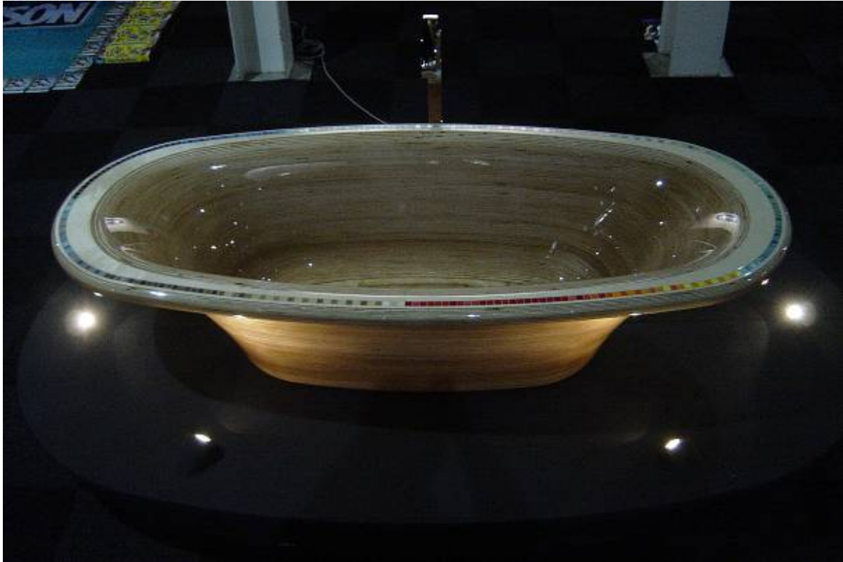
Foto: Het Houten Bad, in 350 laagjes berken, CNC gefreesd en met een 'ketting' van Bisazza Mozaïek in het 'Vier Jaargetijden' Thema van Vivaldi.... En met meer dan 16 lagen van speciale lak als een Riva Sportboot (verschil met de boot: het water zit aan de binnenkant...)